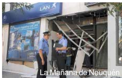
La Mañana de Neuquén

Sebastián Piñera es proclamado oficialmente Presidente electo El Mundo